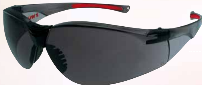
Farba: Sivá Obj.č. 0899 102 311