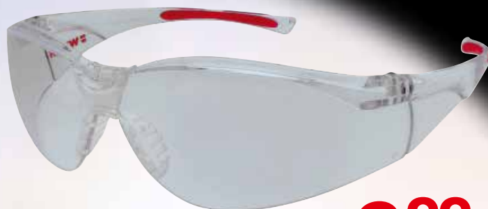
Farba: Číra Obj.č. 0899 102 310