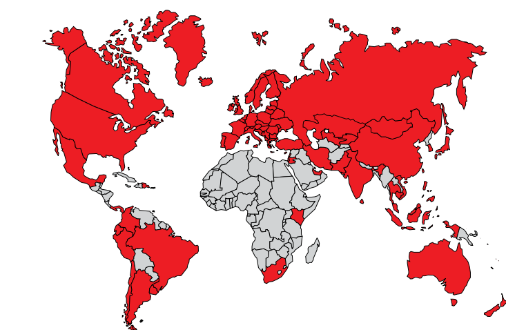
■ Krajiny, v ktorých spoločnosť pôsobí